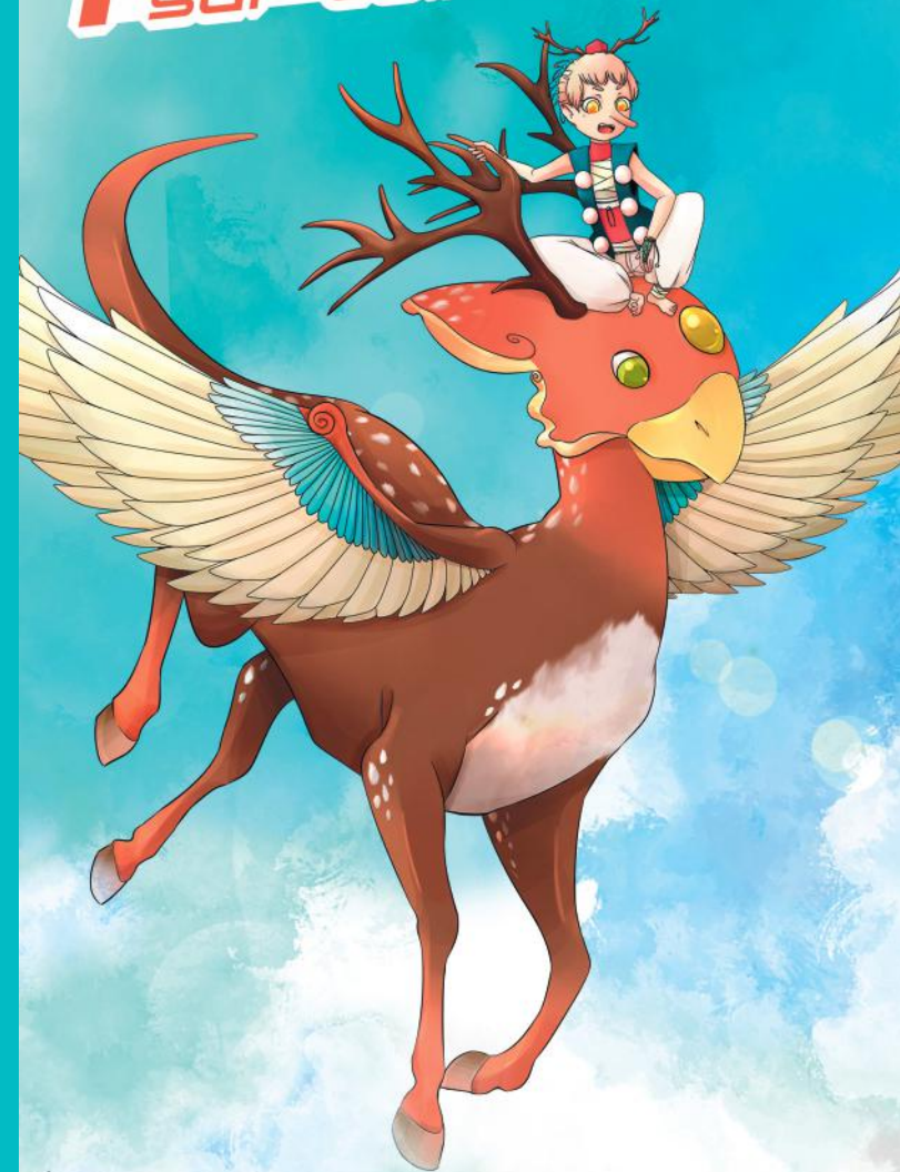
Illustration : Marine Bieret.